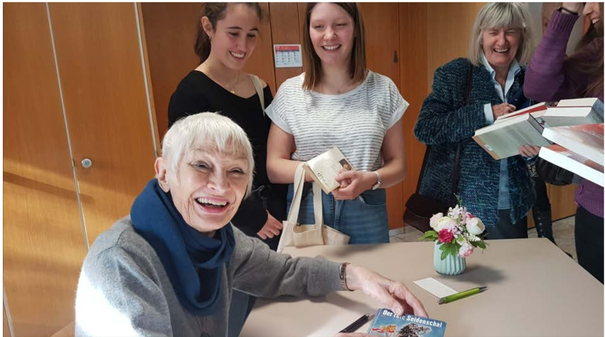
Lesung mit der Autorin Federica de Cesco