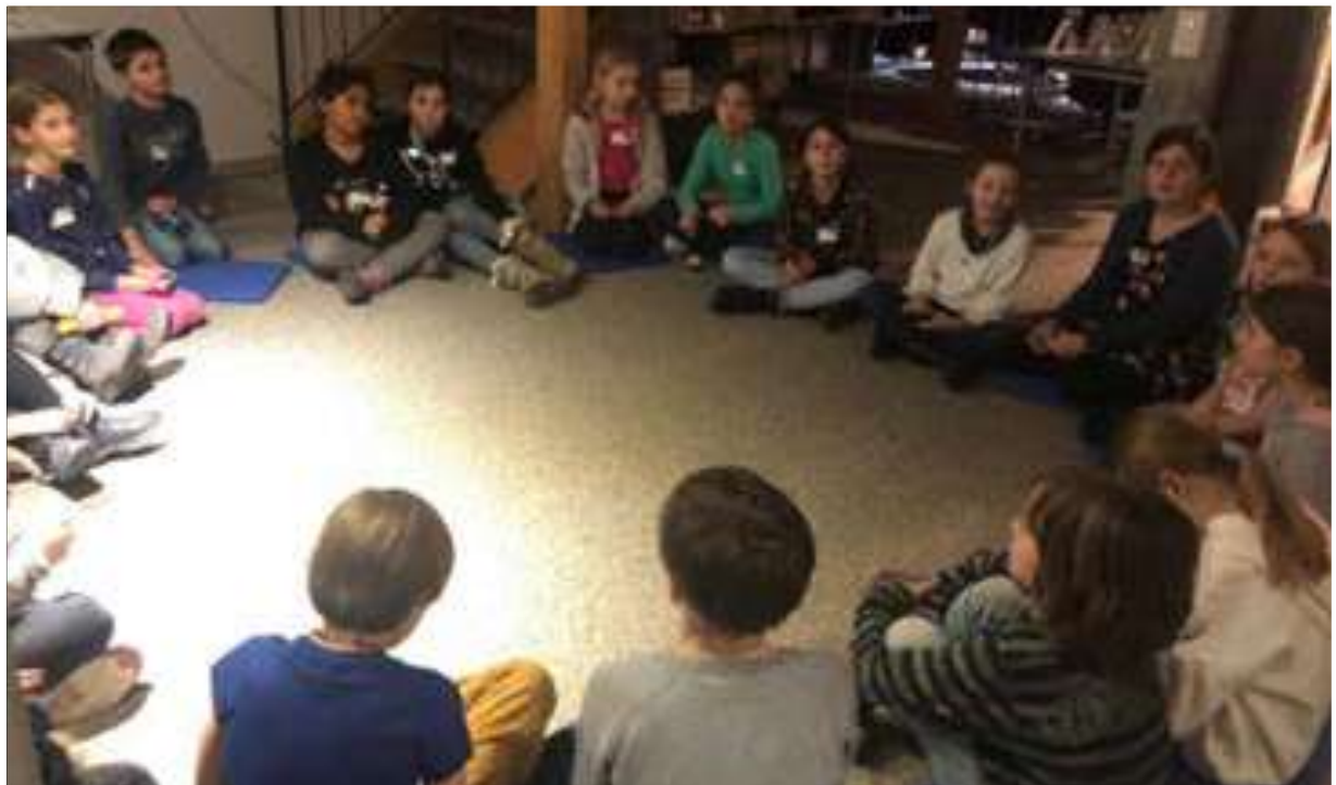
Die Detektive bei der Vorbereitung