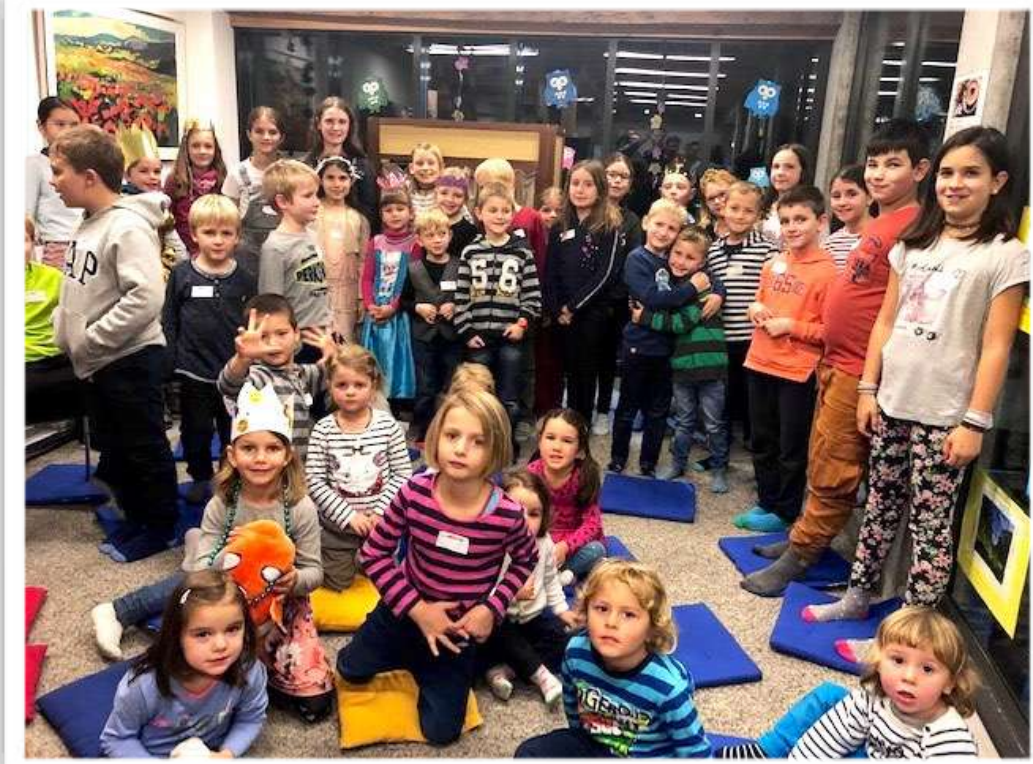
Erzählnacht «Wir Kinder haben auch Rechte»