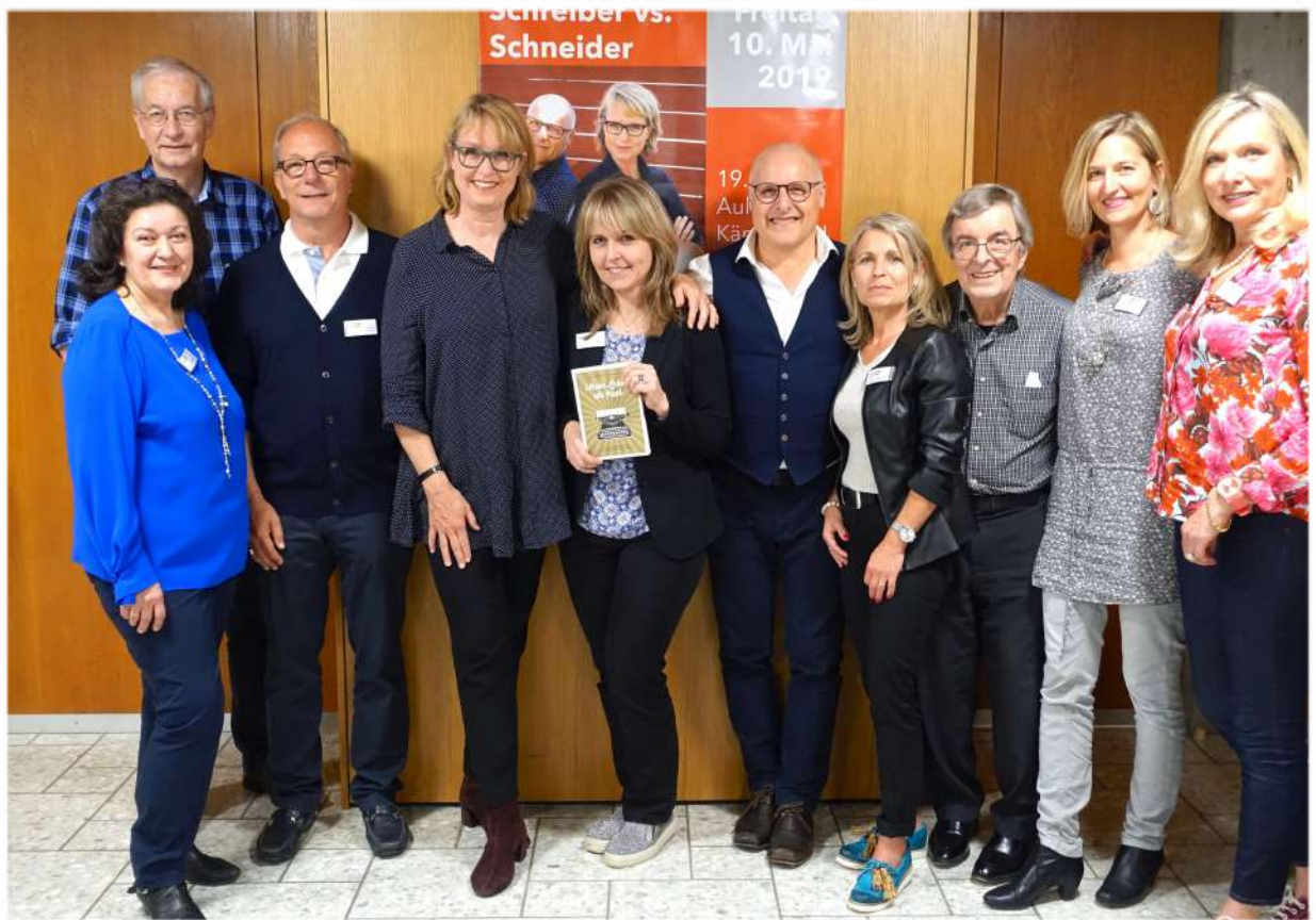
Schreiber vs. Schneider Bibliotheksteam und Vorstand Gönnerverein der Bibliothek