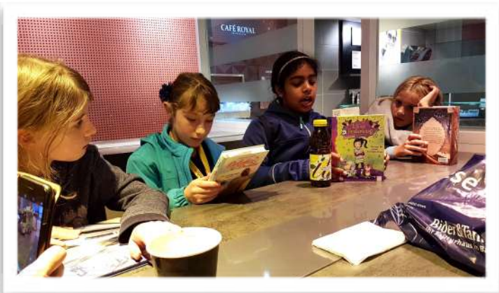
Büchereinkauf mit Kindern und Jugendlichen