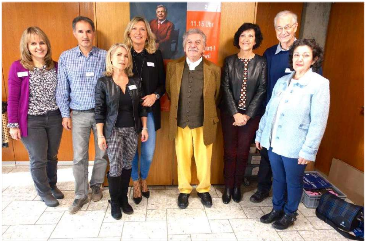
-minu mit Team und Vereins-Vorstand